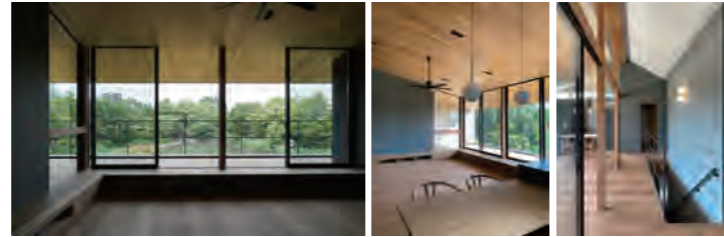
▶ 成田西町の家 | 新築

おかげさまで2023年も多くのお客様ご家族の家づくりに携わせていただき、新築注文住宅・建替え・戸建てリノベーション・マンションリノベーションのお住まいが完成いたしました。弊社を信頼し、大切な家づくりをお任せいただきましたこと、心より感謝申し上げます。どれもお客様のこだわりとこれからの暮らしへの想いが詰まった唯一無二のお家ばかり。ほんの一部ではございますが、2023年に完成したお住まいの写真をご紹介いたします。(現場の進捗により撮影が間に合わず、掲載できなかったお住まいもございます、何卒ご了承ください。)