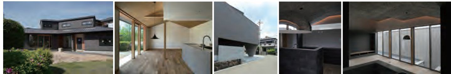
▶ 新築 | 公園を眺める家