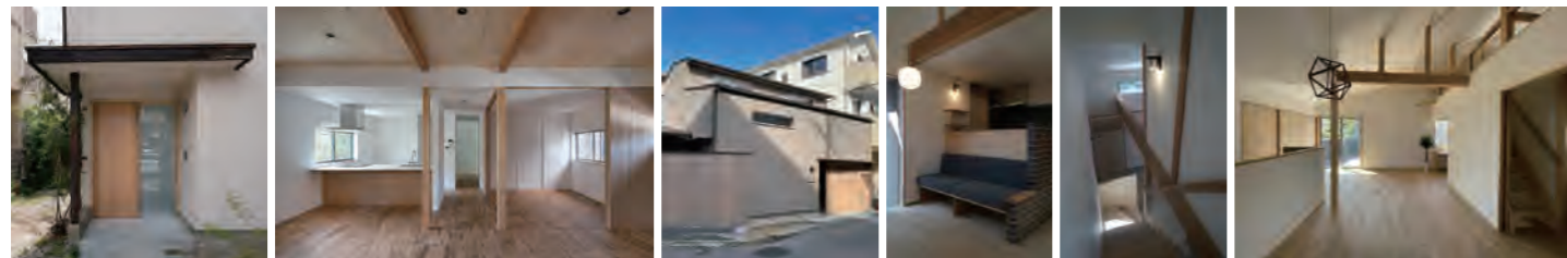
▶ 戸建リノベーション | 吹田の家