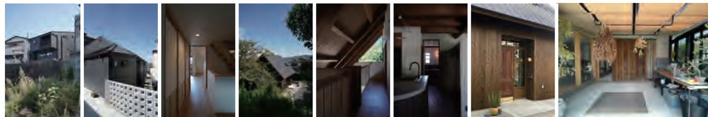
▶ 新築 | 走谷の家