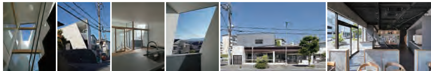
▶ 新築 | 山之上北町の家