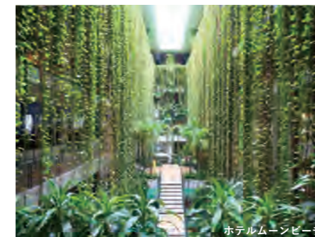
ホテルムーンビーチ

低く水平に広がる檜皮葺(ひわだぶき)の屋根、全てのバランスが秀逸です。拝殿の部戸(しとみど)と中央の観音開き戸が全て解放されて、拝殿手前から奥の夕日に輝く本殿まで見通せる風景は圧巻ですが書籍でしか見たことがありません。参拝するたびに社職の方に訴えるのですが、なかなか開かないとのこと。行かれる方はみなさん社職の方を呼び止めてお願いしてみてください。大胆で繊細、シンプルで複雑なデザインは私にとって学ぶべきところが多い建物なのです。