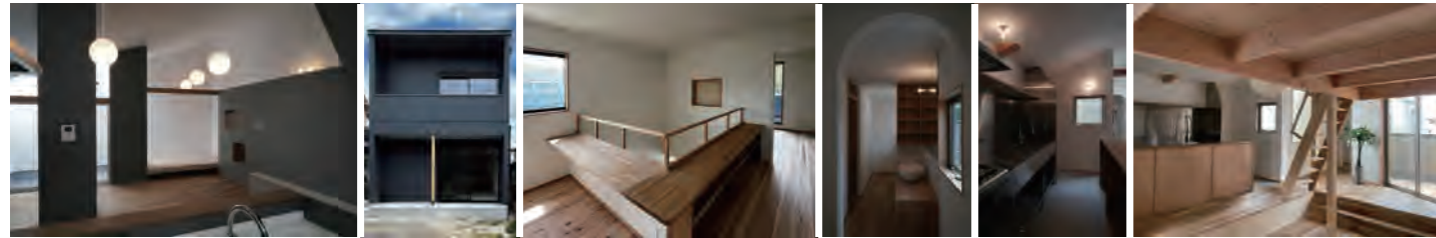
▶ 長尾元町の家 | 新築