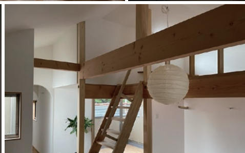
LDK上のロフトは、気分を変えてゴロゴロ風寝をしたり、桜を眺めながらゆっくりとコーヒーを楽しむカフェのようなスペース。