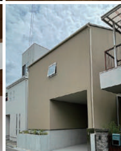
前面道路より外観を望む。ビルトインガレージ横には菜園が。