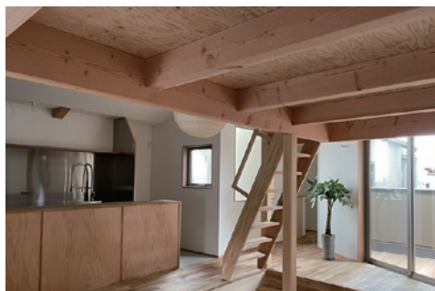
テラス越しに桜の大木を眺める二階のLDK。敷地の高低差を利用して生まれた一段下がったリビングダイニングは落ち着いた空間。

コンパクトながらも自然を取り込む工夫が随所に散りばめられたお住まいとなりました。 (建築家・藤森大作)