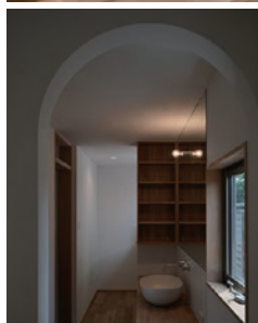
水廻りは効率よくまとめて動線短く、洗面と脱衣は小スペースながらも分けて心地良い空間に。