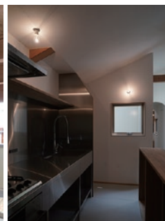
厨房のようにガンガン使えるこだわりのステンレスキッチン。